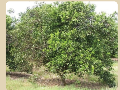
Blight-infected tree with sectoring (disease symptoms are unevenly distributed) Árbol afectado por blight (síntomas no uniformes en el árbol)