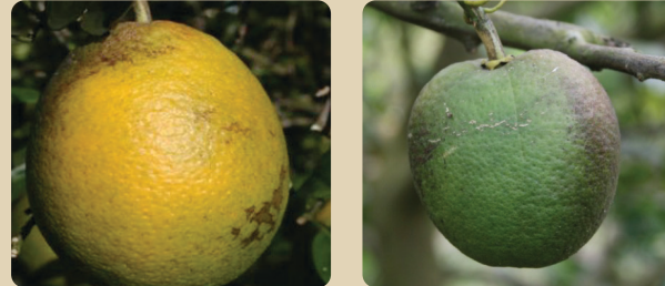
Yellow stain beneath the calyx button Teñido amarillo debajo del botón