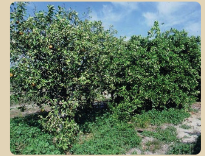
Blight tree (left) versus healthy tree (right) Árbol con blight (izquierda) comparado con uno sano (derecho)