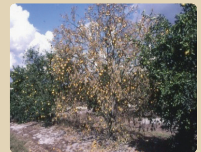
Citrus tristeza decline (on sour orange rootstock) Declinamiento por tristeza sobre pie de naranjo agrio

*To identify a blight tree, use a drill and syringe to test the water uptake (see http://edis.ifas.ufl.edu/HS241 ).